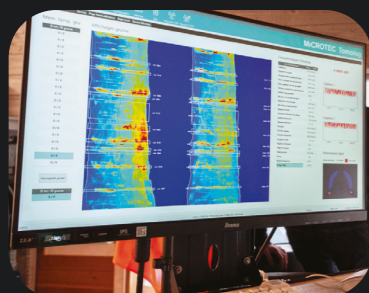
INTELLIGENCE ARTIFICIELLE Pour un tri précis et une qualité constante