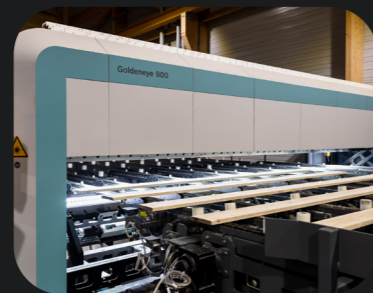
SCANNER GOLDENEYE Qualité des sciages