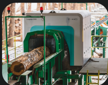
SCANNER RAYONS X Pour analyser et optimiser le sciage

Pour la Scierie Raboterie Lemaire, l'innovation est donc un levier industriel, mais aussi un engagement : valoriser à 100% ce que la forêt nous offre, produire avec précision et sécuriser la qualité finale des bois transformés.